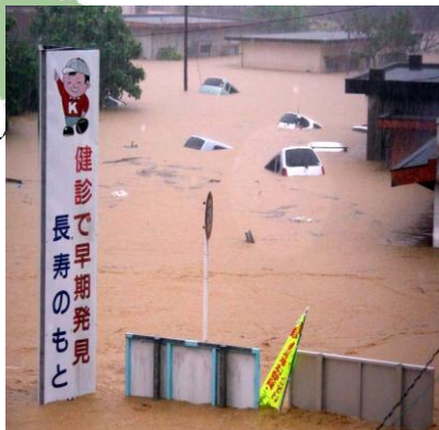
2010年10月奄美豪雨災害